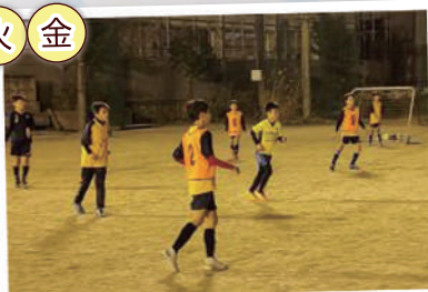
ジュニアサッカー