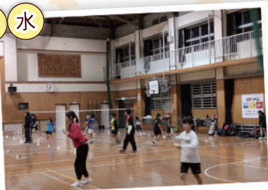
ジュニアバドミントン